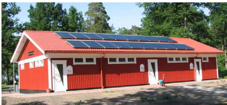
Campingplats Ekudden – Mariestad kommun (2007)

Sedan det så kallade solvärmebidraget infördes 2000 har försäljningen av glasade solfångare i mindre system ökat med i genomsnitt 20% per år och 2006 installerades det knappt 30 000 m 2 glasade solfångare (20 MWth) i Sverige. Försäljningen förväntas öka i motsvarande grad de närmaste åren, men en allmän nedgång för värmeinstallationer visar sig också i en minskning för solvärmesystem under 2007. I dagsläget uppförs ca hälften av de glasade solfångarna med det bidrag som fn gäller tom december 2010.