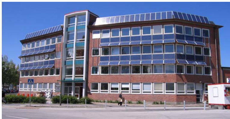
Kårhuset i Malmö – Malmö stad stadsfastigheter (2007).

Tack vare investeringsstödet har installationerna ökat under de senaste åren för att uppgå till drygt 10 000 m 2 (ca 1 300 kWe) under 2007. De förväntas dock inte få samma ökade omfattning under 2008 (investeringsstödet gäller f.n. tom december 2008, men alla medel är upptecknade).